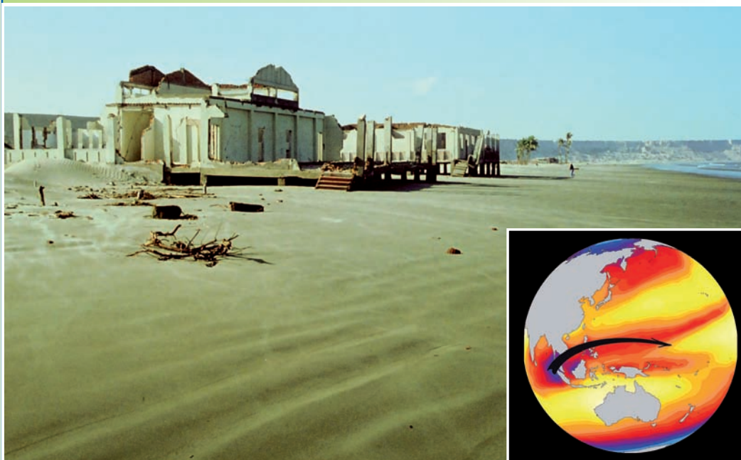
Destructions d'édifices dans la Baie de Paita au nord du Pérou lors de l'événement El Niño de très forte intensité de 1982-83. En médaillon, Figure 1 : à l'automne (ici en octobre), l'est de l'océan Indien peut avoir une forte influence (flèche noire) sur les vents du Pacifique.

S écheresse en Afrique australe, inondations en Amérique latine, mousson très faible en Asie du sud-est : El Niño, phénomène océanique et atmosphérique issu d'une anomalie de température du Pacifique tropical, sème le désordre dans le climat mondial. Tous les deux à sept ans, ses répercussions socio-économiques et environnementales à l'échelle du globe peuvent être dramatiques. Malgré d'importantes avancées dans la compréhension de ce réchauffement cyclique des eaux du Pacifique tropical, sa prévision à long terme reste encore un défi. Des chercheurs de l'IRD et leurs partenaires 1 viennent d'identifier un élément essentiel et encore méconnu du déclenchement d'un tel événement : le « dipôle de l'océan Indien », une anomalie climatique équivalente à celle du Pacifique. Ce phénomène module la circulation atmosphérique Indo-Pacifique ainsi que les vents sur le Pacifique équatorial. Sa disparition rapide à la fin de l'automne favorise le développement d'un El Niño, qui atteindra son apogée environ 14 mois plus tard. La prise en compte du dipôle de l'océan Indien permet ainsi de mieux prévoir l'arrivée et l'intensité de ce dernier.