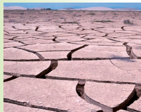
Fentes de dessiccation dans un fond de lagune au Pérou après les inondations de 1983 dues à El Niño.