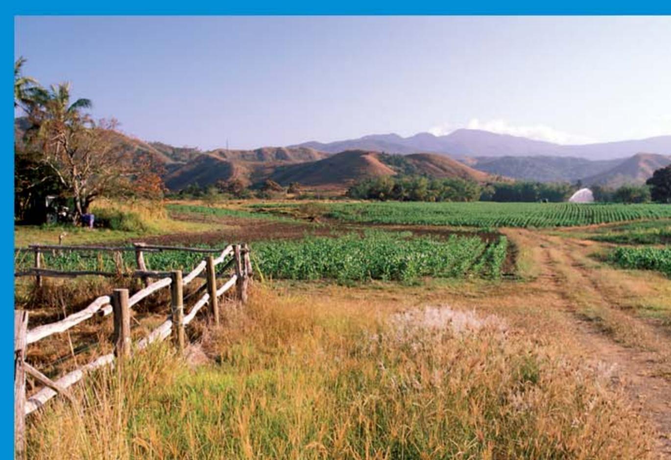
Cultures extensives en Nouvelle-Calédonie.