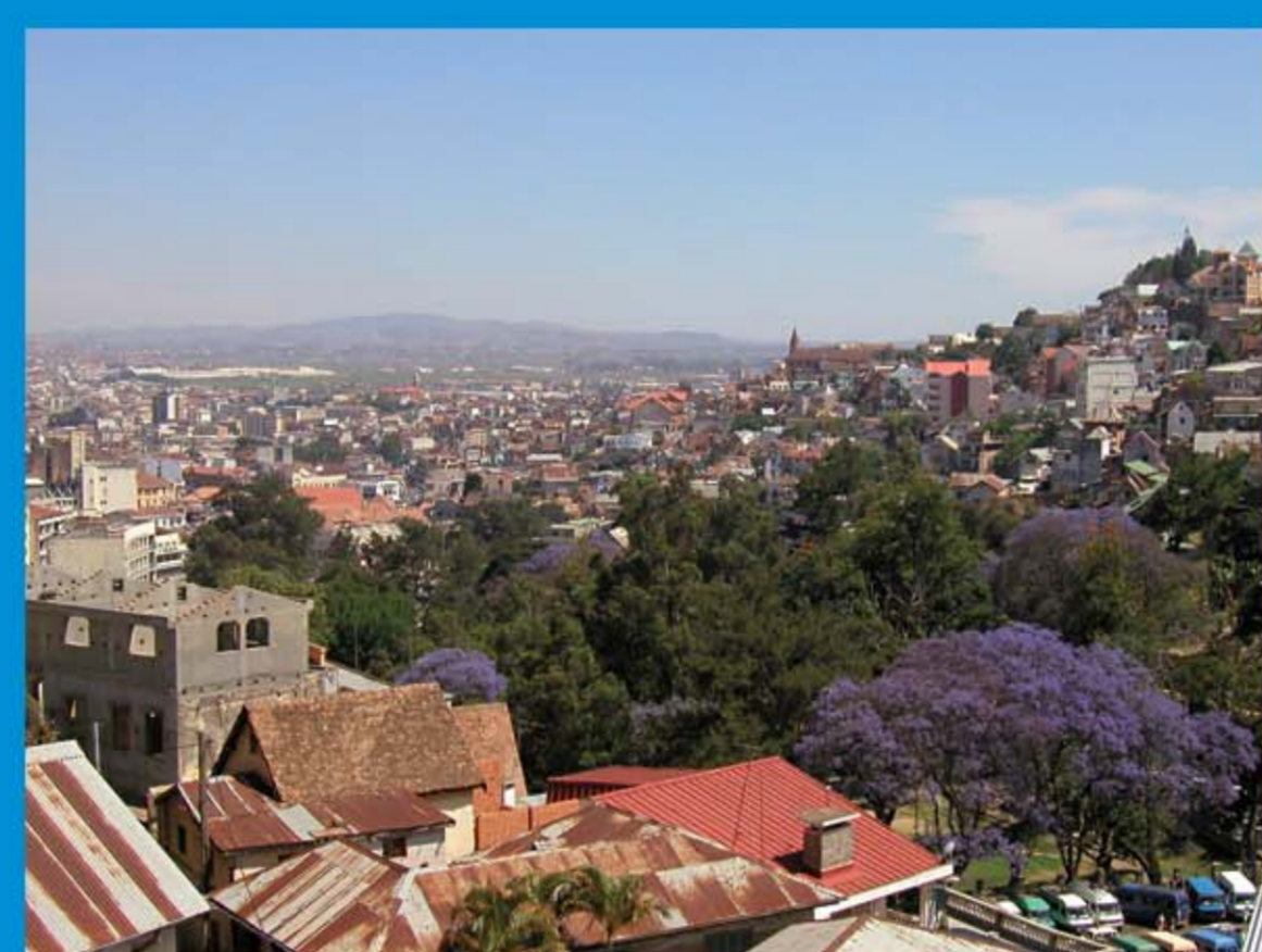
Parc urbain à Antananarivo, Madagascar.