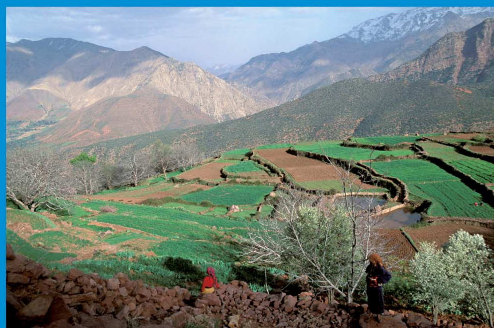
Paysage agricole dans le Haut-Atlas marocain.

Le terme « nature » est souvent utilisé pour désigner des écosystèmes vierges, non perturbés par l'homme. Cependant, en Europe, ces espaces ont été profondément modifiés par des siècles d'exploitation agricole et industrielle, transformés en champs cultivés, prairies, bocages, forêts pour la production de bois, parcs urbains... Les forêts équatoriales ont également été sillonnées et habitées par des peuples pratiquant la cueillette, la chasse et l'agriculture. Ce que nous appelons « nature » recouvre aussi bien les écosystèmes encore peu touchés par l'homme que les milieux artificialisés.