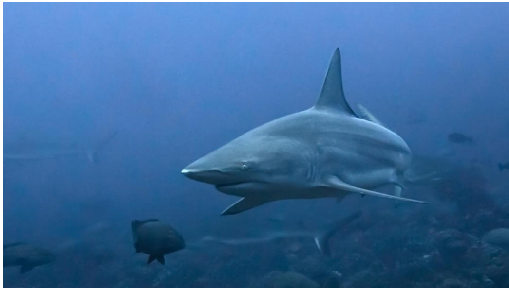
Légende photo : requin gris

Cependant, les données scientifiques disponibles sur cette zone restent incomplètes ou inexistantes. Ces éléments avaient d'ailleurs été soulignés dans l'analyse écorégionale marine menée en 2009 par le WWF et l'Agence des aires marines protégées.