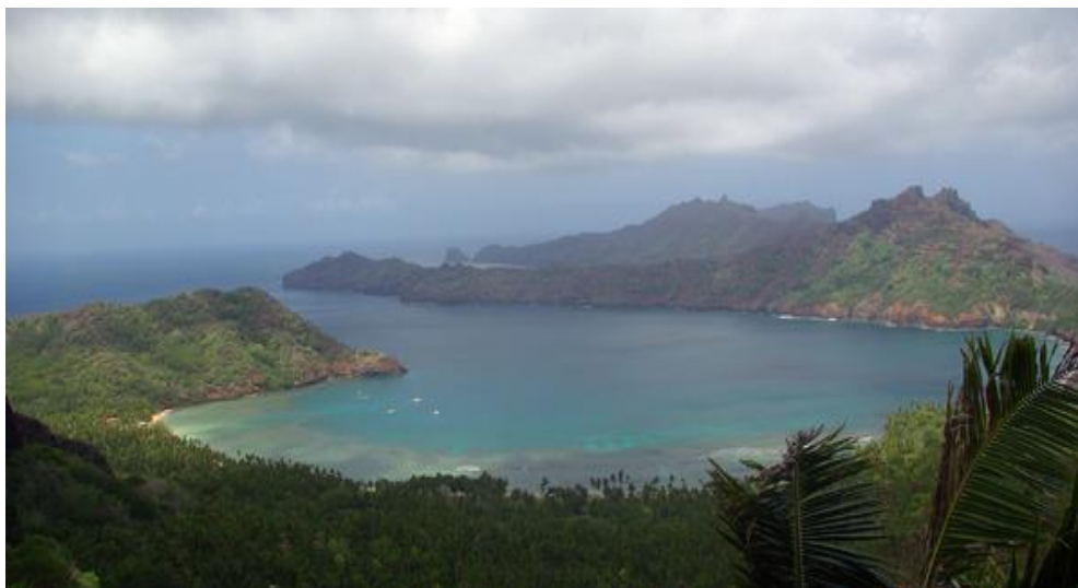
Légende photos : baie de Anaho, Nuku Hiva