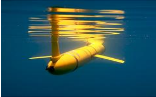
Le glider, planeur sous-marin autonome mis à disposition de la campagne par « Tara expédition » va permettre d'étudier les caractéristiques physicochimiques de la colonne d'eau.

Le navire océanographique néozélandais « Braveheart » quittera Papeete le 21 octobre 2011 à destination des Marquises. A partir du 25 octobre 2011 jusqu'au 23 février 2012, quatre équipes d'une dizaine de scientifiques chacune se relayeront à bord du navire au départ de l'archipel. Outre les scientifiques et les plongeurs, ce navire, équipé de laboratoires, embarquera du matériel d'échantillonnage, un ROV 3 et un glider 4 . La campagne sera découpée en quatre parties. A chaque rotation, une équipe embarquera pour étudier une nouvelle thématique.