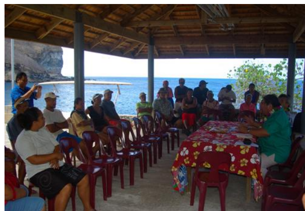
Légende photos : baie de Hakahetau à Ua Pou et réunion publique à Ua Pou

Quelques personnes des Marquises pourront également embarquer à la journée lors des travaux en mer. Enfin, un partenariat pédagogique avec des écoles des Marquises permettra aux élèves de suivre la campagne, de rencontrer les scientifiques, voire de monter à bord.