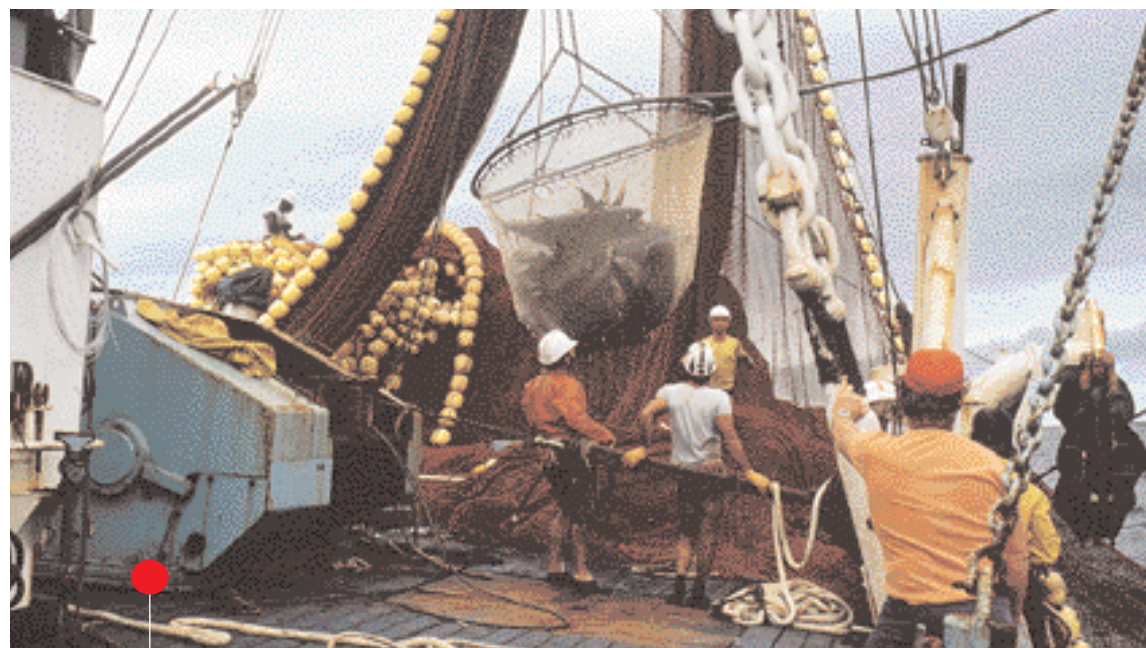
80 % de la pêche thonière mondiale s'effectue en zone intertropicale, ce qui représente près de 4 millions de tonnes chaque année.

œuvre dans les océans Atlantique et Indien sous l'égide des commissions thonières internationales*. Ces recherches visent un double objectif : le développement soutenu de la pêche thonière et la préservation de la ressource. Parmi les avancées auxquelles ont contribué les études récentes : la prospection acoustique