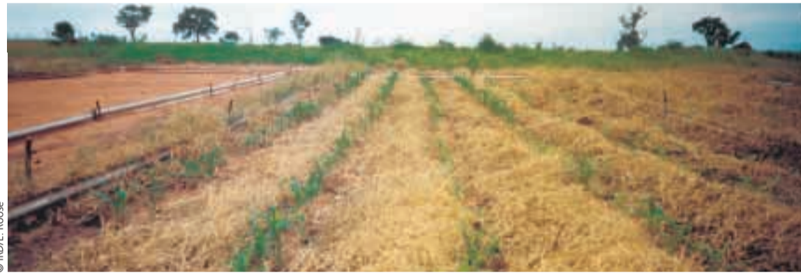
Le sol non labouré, couvert d'une litère de résidus et d'adventices, ne craint pas les pluies. On voit ici au Nord-Cameroun l'application du semis direct à une rotation maïs - coton.