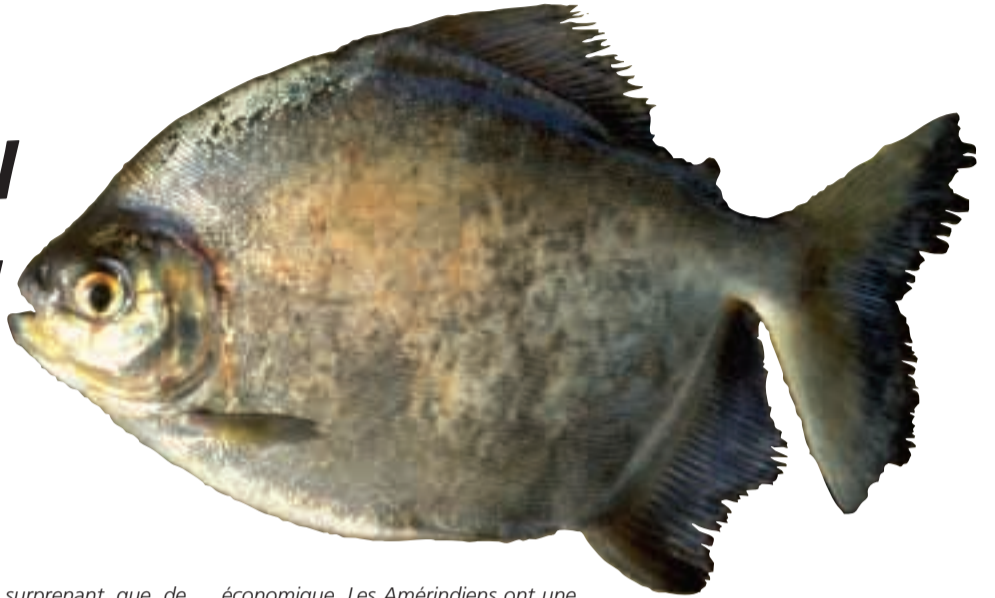
L'importance sociale du Tometes lebailli ( watau yaiké en wayana ) est notamment attestée par les dessins d'enfants du village Pidima dans le Haut-Maroni.