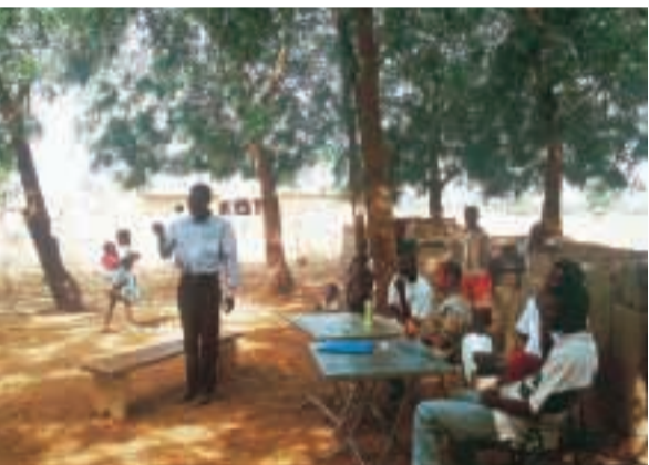
Lors d'une enquête alimentaire, explication du travail de l'équipe de chercheurs de l'IRD par le délégué villageois.

Gardner, M.J., et al. Genome sequence of the human malaria parasite Plasmodium falciparum . Nature , 419, 498-511, 2002.