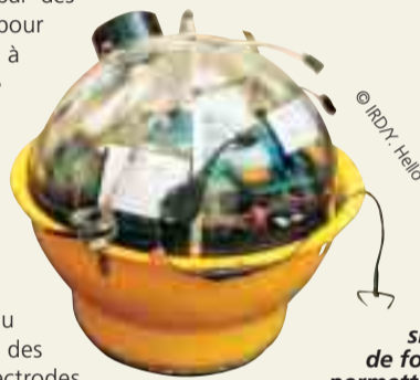
Ocean bottom sismometer, sismographe de fond de mer. Ils permettent d'étudier les séismes ou de réaliser des expériences de sismique réflexion. Voir Sciences au Sud n° 6, page 6 et n° 21 page 3, ainsi que les deux reportages diffusés sur canal IRD : http://www.canal.ird.fr