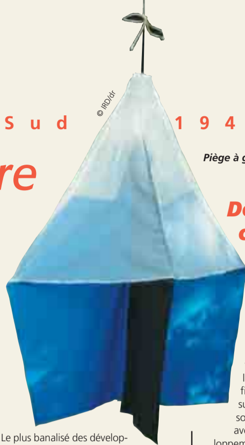
Piège à glossines.

Dans le domaine des sols et des océans, de nombreux dispositifs spécifiques ont été mis au point, à l'image des récentes micros électrodes pour la mesure du potentiel redox des sols utilisées par l'IRD et par l'INRA ou de la fameuse « Dandonette », un système de prélèvement d'échantillons de chlorophylle marine.