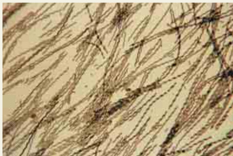
Microphotographie d'une souche de Spirulina isolée d'un sol de rizière des Philippines.

De nombreuses expériences, menées par des équipes du monde entier,