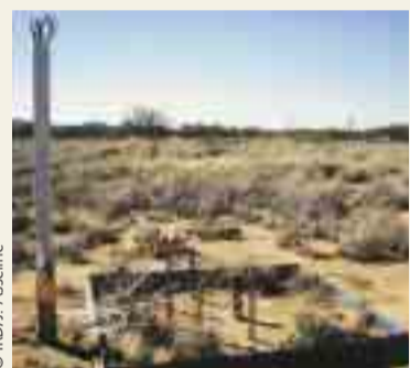
Simulateur de pluie et microparcelles préparées pour des tests sous simulation de pluie, équipée afin de suivre l'évolution de l'infiltration puis la dessiccation.