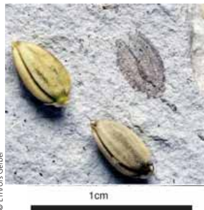
Photo du fossile d'épillet inclus dans une roche calcaire fine et de deux épillets de l'espèce Oryza granulata originaire de Birmanie et cultivée en serre. À droite, copie d'un des dessins publiés par Oswald Heer en 1855 sous l'appellation Oryza exasperata . Tous les fossiles dessinés ont été retrouvés.

Pourquoi un tel intérêt pour cet échantillon ? « À l'heure où le riz et ses principaux parents sauvages figurent parmi les plantes dont le génome est le plus décrypté, ce fossile peut apporter une preuve permettant de situer l'origine du riz dans le temps et l'espace », répond Gérard Second et il ajoute « en cohérence avec les toutes récentes