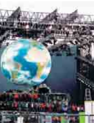
Depuis le Sommet de Johannesburg (2002), les pays du Sud revendiquent un « régime international d'accès et de partage des avantages » de la biodiversité.

objectif concernant l'accès et le partage équitable des avantages tirés de l'exploitation des ressources génétiques. La CDB reposait sur l'hypothèse que le marché des ressources génétiques allait connaître un essor considérable et qu'il convenait de mettre en place des procédures d'accès transparentes à la biodiversité du Sud, de façon à en finir avec les pratiques qualifiées de biopiraterie (voir sciences au sud n° 29). La CDB devait, par l'affirmation de la souverai-