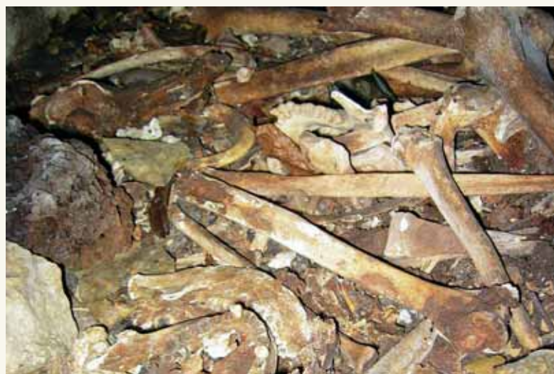
Dans une grotte de Salea, région d'Hokua - Nord Cumberland, ossements humains et canines (tusker) de suidés.