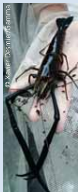
"Chevrette" pêchée dans la rivière Pénaorou, à 400 mètres d'altitude au nord-ouest de l'île de Santo.