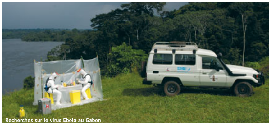
Recherches sur le virus Ebola au Gabon