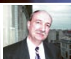
Agence comptable Jean Fohrer