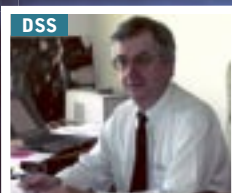
DSS Département Sociétés et santé Jacques Charmes