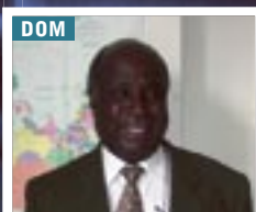
DOM Délég. à l'outre-mer Roger Bambuck