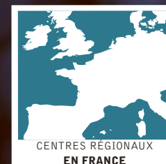
CENTRES RÉGIONAUX EN FRANCE