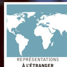
REPRÉSENTATIONS À L'ÉTRANGER

UNITÉS DE RECHERCHE (UR) ET DE SERVICE (US)