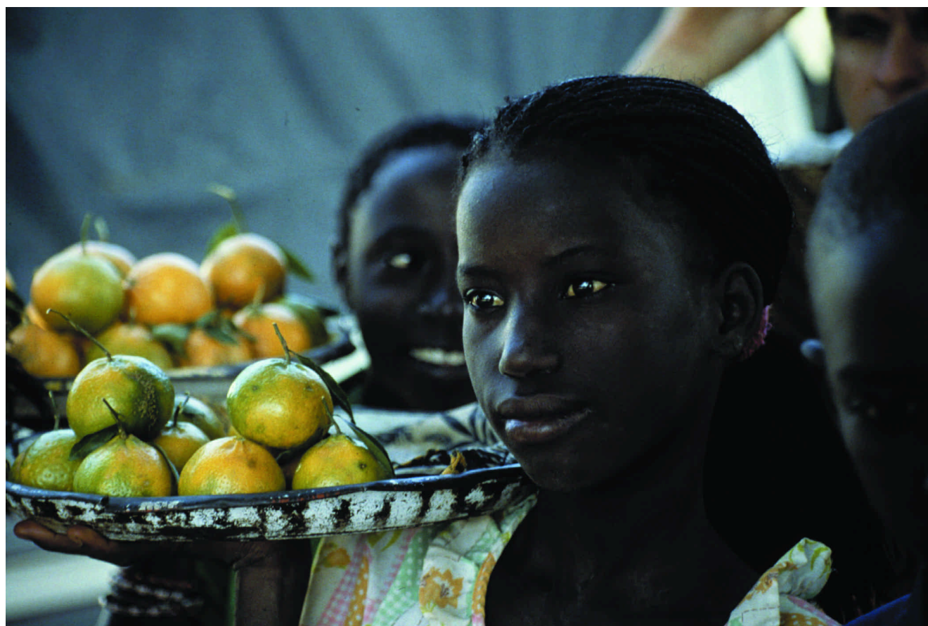
Une jeune marchande de fruits (Lac rose, Sénégal).

Jacques Berger Ambassade de France Service Culturel, 57 Than Hung Dao Hanoi Tél. : (84 4) 831 45 59 Fax : (84 4) 831 45 58 repird@fpt.vn