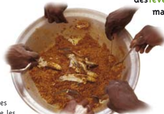
Leriz au poisson, le « thieboudiène » est le plat national sénégalais. Avec 35 kg par habitant et par an, le Sénégal est l'un des premiers consommateurs de poisson en Afrique et dans le monde.

La pêche industrielle, utilisant des techniques peu sélectives comme les filets dérivants ou les sennes tournantes, capture des espèces non ciblées qu'elle rejette en mer entraînant un gaspillage énorme. Près de 20 millions de tonnes de poissons sont rejetés chaque année en mer (soit 1/5 de la production mondiale), la plupart à pure perte, sans compter les mammifères marins, les tortues et les oiseaux de mer victimes de ces techniques !