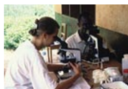
Sécurité sanitaire, politiques de santé et accès aux soins