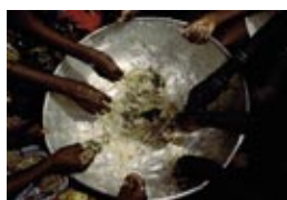
Sécurité alimentaire dans le Sud