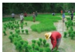
Gestion durable des écosystèmes du Sud