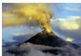
Risques naturels, climats et ressources non renouvelables : impacts pour l'environnement et les populations du Sud

Présent en Afrique, dans les pays du pourtour méditerranéen, en Asie, dans l'océan Indien, en Amérique latine et dans le Pacifique, l'Institut de recherche pour le développement conduit des recherches centrées sur les relations entre l'homme et son milieu dans les régions tropicales et méditerranéennes, dans la perspective d'un développement durable. Pour répondre aux enjeux majeurs du développement, l'IRD décline ses recherches autour de six grands axes :