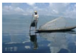
Eaux continentales et côtières : ressources et usages au Sud