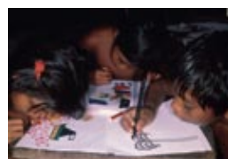
Développement et mondialisation : dynamiques socio-économiques, identitaires et spatiales

Au sein de ces grands champs de recherche, l'IRD concentre ses activités autour de six priorités scientifiques :