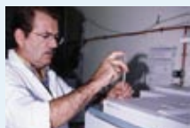
Plate-forme d'essais cliniques

Partenaires : 4 membres de l'UE (Allemagne, Espagne, France, Portugal) et la Norvège. 5 pays latino-américains (Argentine, Brésil, Chili, Mexique et Uruguay).