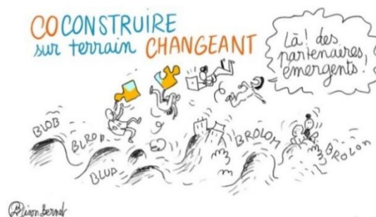
Faire ensemble dans un contexte de crise. Illustration : Lison Bernet